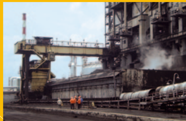
3 Grúa semi-pórtico para manipulación de coque de petróleo con cuchara de 10 m 3 , capacidad 25 t, luz 26,92 m, Dumai (Indonesia).

In addition, these cranes require a full availability in order not to interrupt the plant's output capacity – consequently, given their importance within the process, most of their major components are designed with redundant back-ups in order to minimise the risk of stoppage during production.